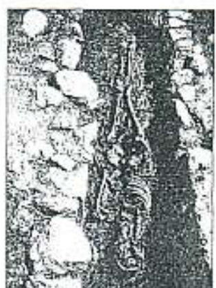
A la izquierda, sección transversal del hipogeo, hallado en el tercer nivel del aparcamiento, con la fosa de las tumbas en primer término. En la foto superior, los cinco pendientes de oro encontrados en el enterramiento colectivo, cuyas dimensiones se pueden apreciar en una imagen inferior. Junto a ella, una de las tumbas con uno de los restos completos.